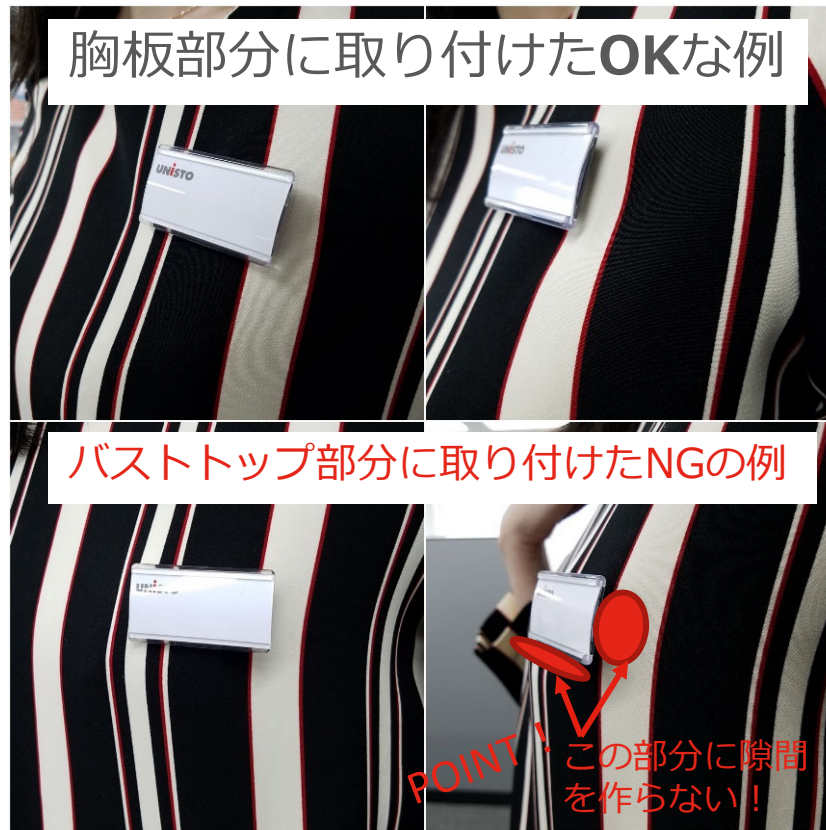
バストトップ部分に取り付けたNGの例