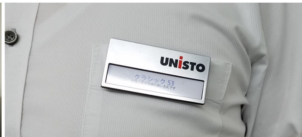
ウニストの「クラシックS3」名札を使用