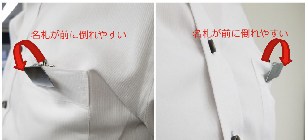
一般的な両用ピン付き金属製名札を使用