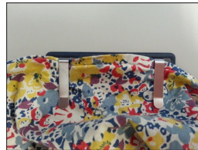
③もう片方のクリップに洋服を差し込み上まで引き上げる。