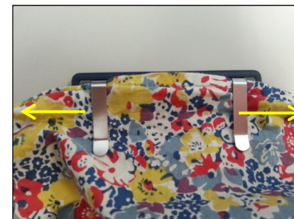
④たわんだ洋服を両方向にひっぱり整える。