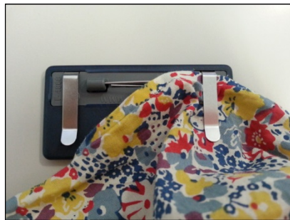
①片方のクリップに洋服を差し込み上まで引き上げる。

クリップ裏のグレー部分にある凸を越えて深くクリップを洋服等に挿す。 (安全ピン/ブローチピンにしっかりと洋服等が被さるようにする。)